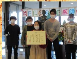
▲医師会看護専門学校