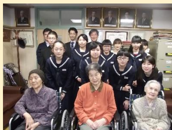
▲H28 養護老人ホーム長生園