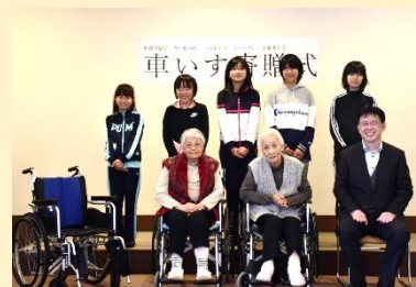
▲R1 特別養護老人ホーム えぞりんどうの里