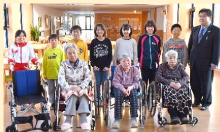
▲H29 特別養護老人ホーム鶴の園