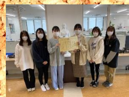
▲労災看護専門学校